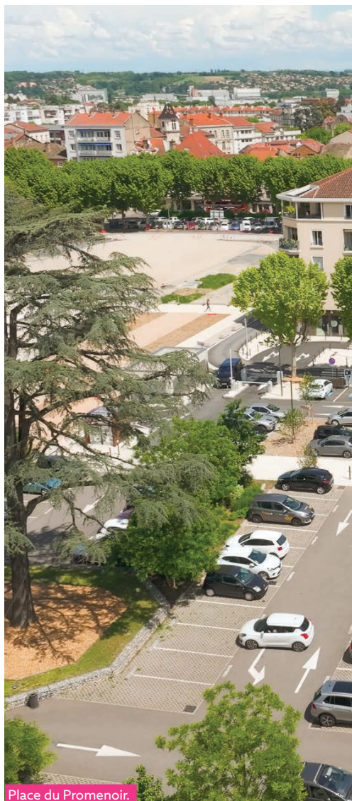
Place du Promenoir.