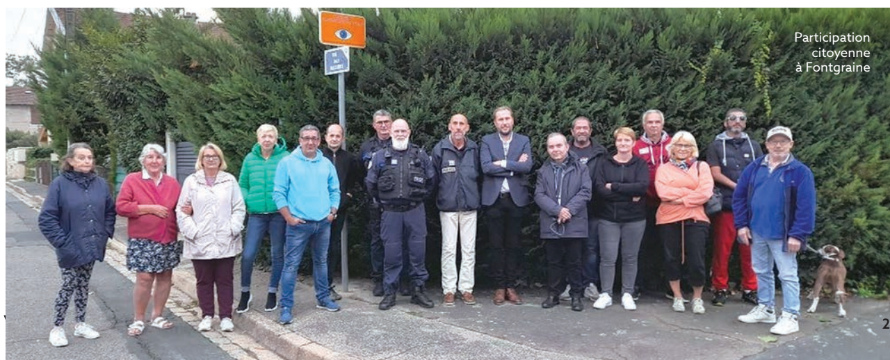
Participation citoyenne à Fontgraine

Contact : 04 74 62 60 49 - securite@villefranche.net