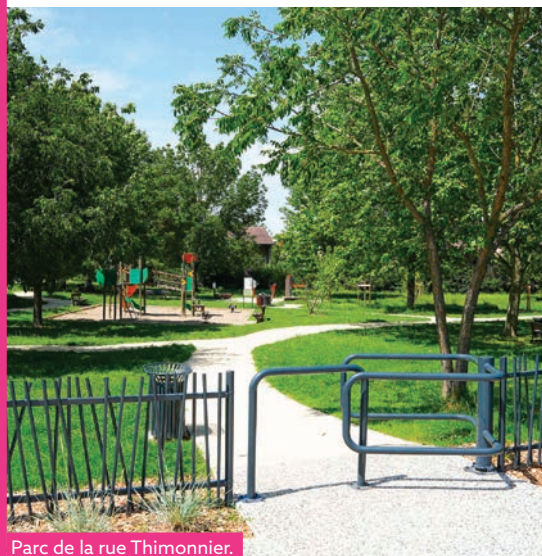
Parc de la rue Thimonnier.