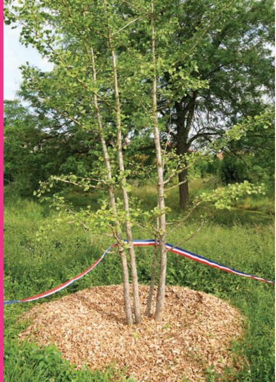
Plantation du 1000 e arbre par le chef papou,

Un patrimoine végétal repensé, au service du bien-être des Caladoises et Caladois.