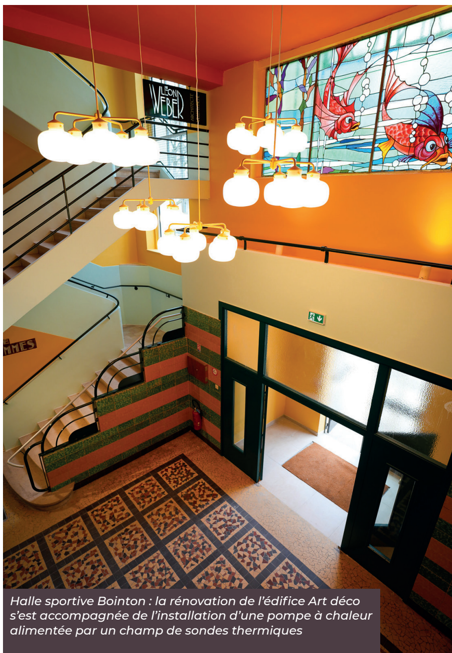
Halle sportive Bointon : la rénovation de l'édifice Art déco s'est accompagnée de l'installation d'une pompe à chaleur alimentée par un champ de sondes thermiques