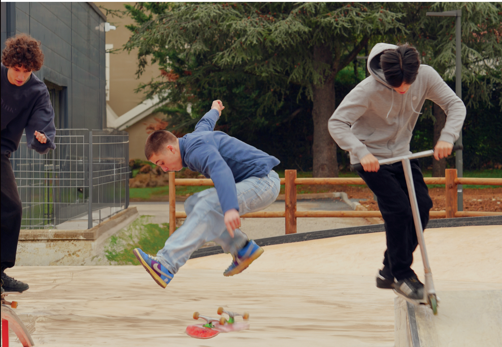
Le nouveau skate park, installé entre le Palais des sports et le Dojo