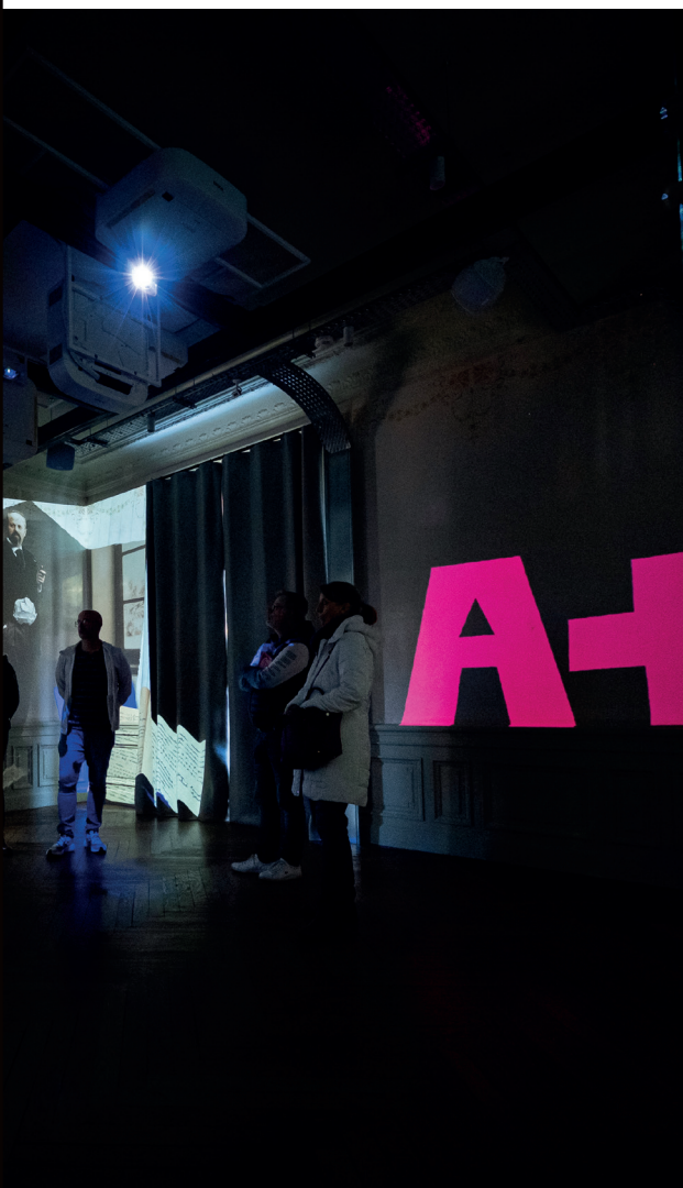
Les visites immersives de la Maison Vermorel, entièrement réhabilitée, connaissent un succès mérité.