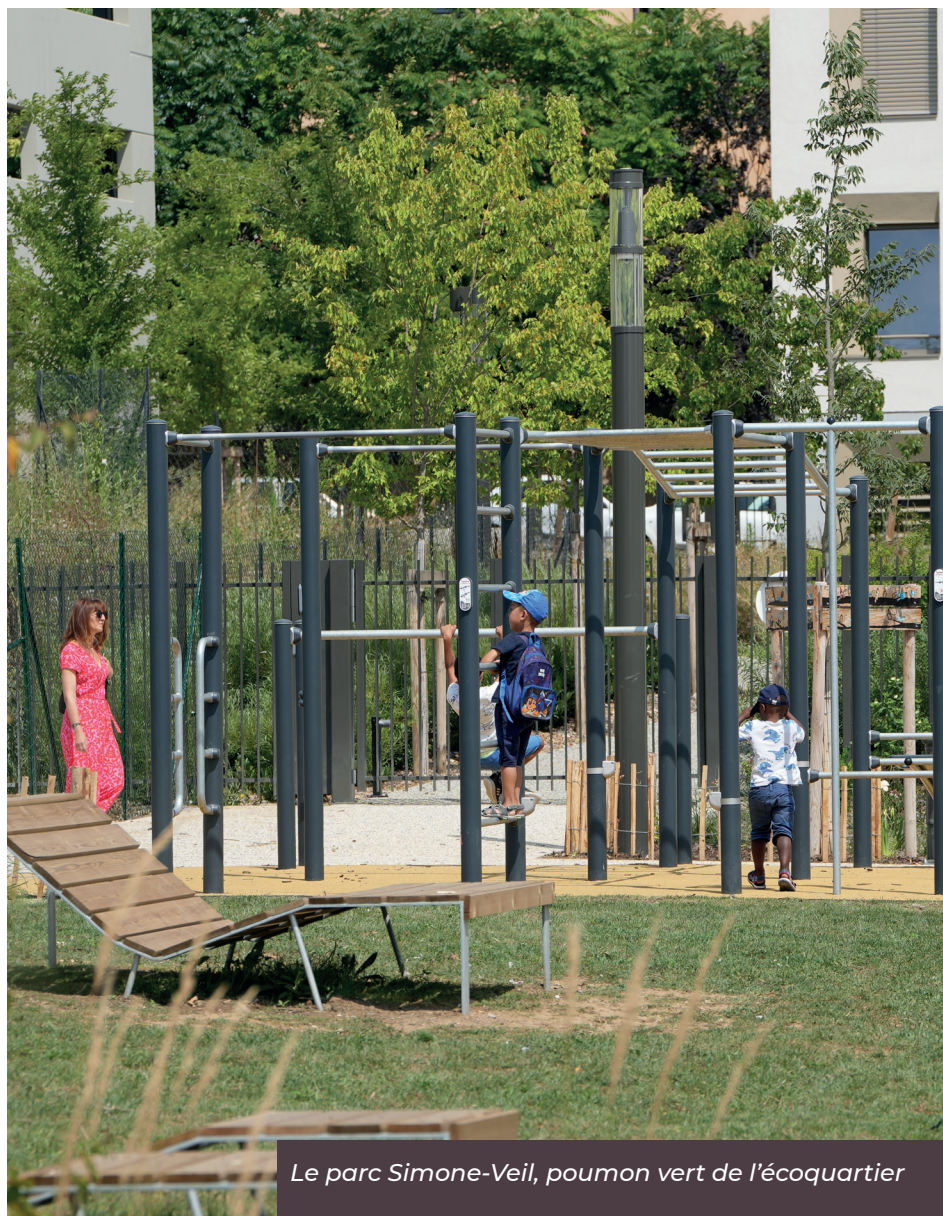
Le parc Simone-Veil, poumon vert de l'écoquartier