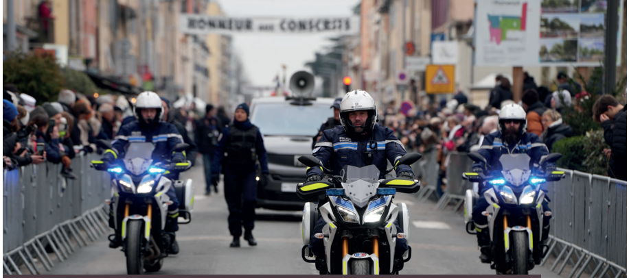
La Police municipale participe à la sécurisation de tous les grands événements de la cité (ici, la Vague des Conscrits®).