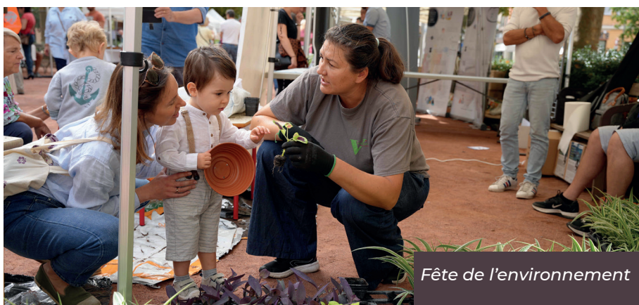
Fête de l'environnement