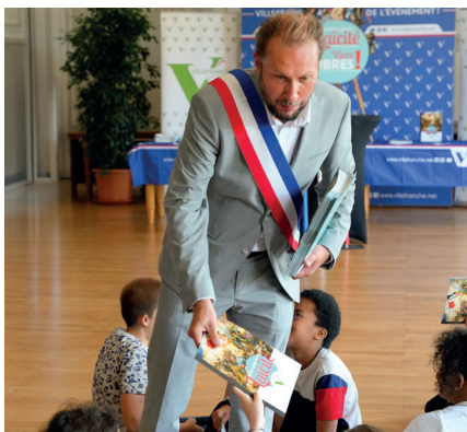
La remise, par la Ville, du grand Livre de la Laïcité vient clore de façon marquante le passage à l'école primaire.

La collectivité municipale s'est également saisie de la thématique défense du pouvoir d'achat : opération d'achat groupé d'énergies, partenariat sur le dispositif Ma mutuelle Région Auvergne-Rhône-Alpes, etc.