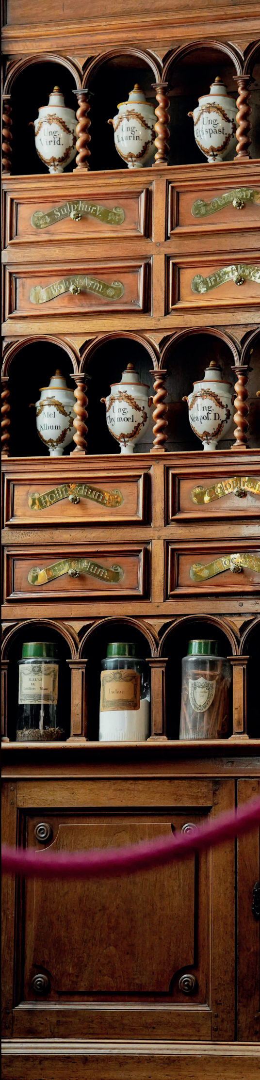
Apothicaire de l'Hôtel-Dieu (1673)