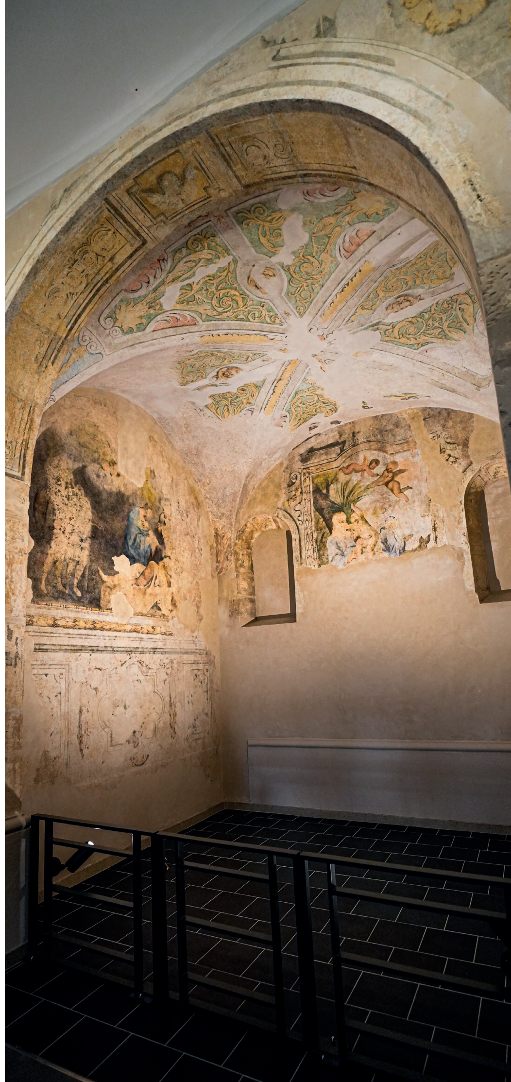
Représentations bibliques à la Bourse du travail (ex. couvent des Visitandines)