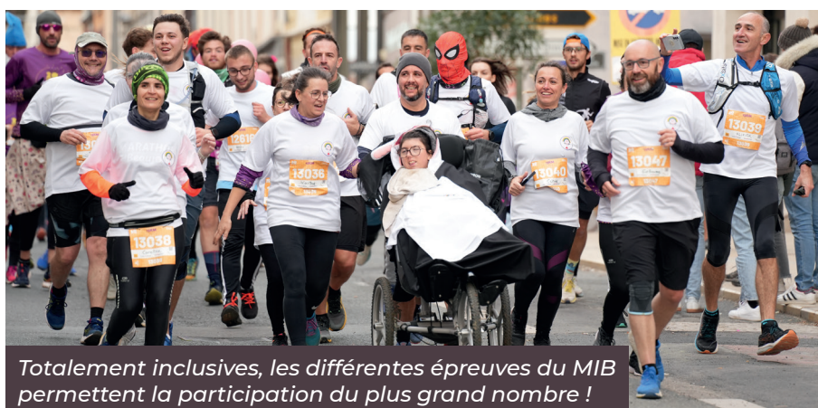
Totalement inclusives, les différentes épreuves du MIB permettent la participation du plus grand nombre !

A cela s'ajoutent des événements fédérateurs dont profite le plus grand nombre : Boum des 10 ans, Forum des associations, Soirée Champions, Don de sang, Parade des motards du Bycoeurs Child Safe, etc.