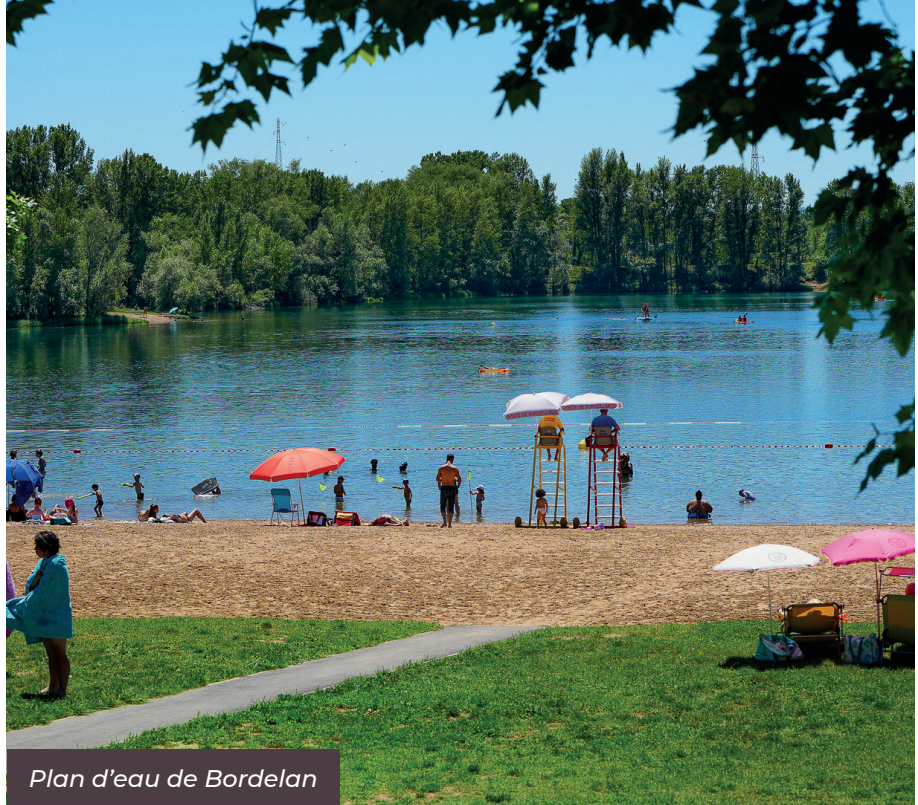
Plan d'eau de Bordelan