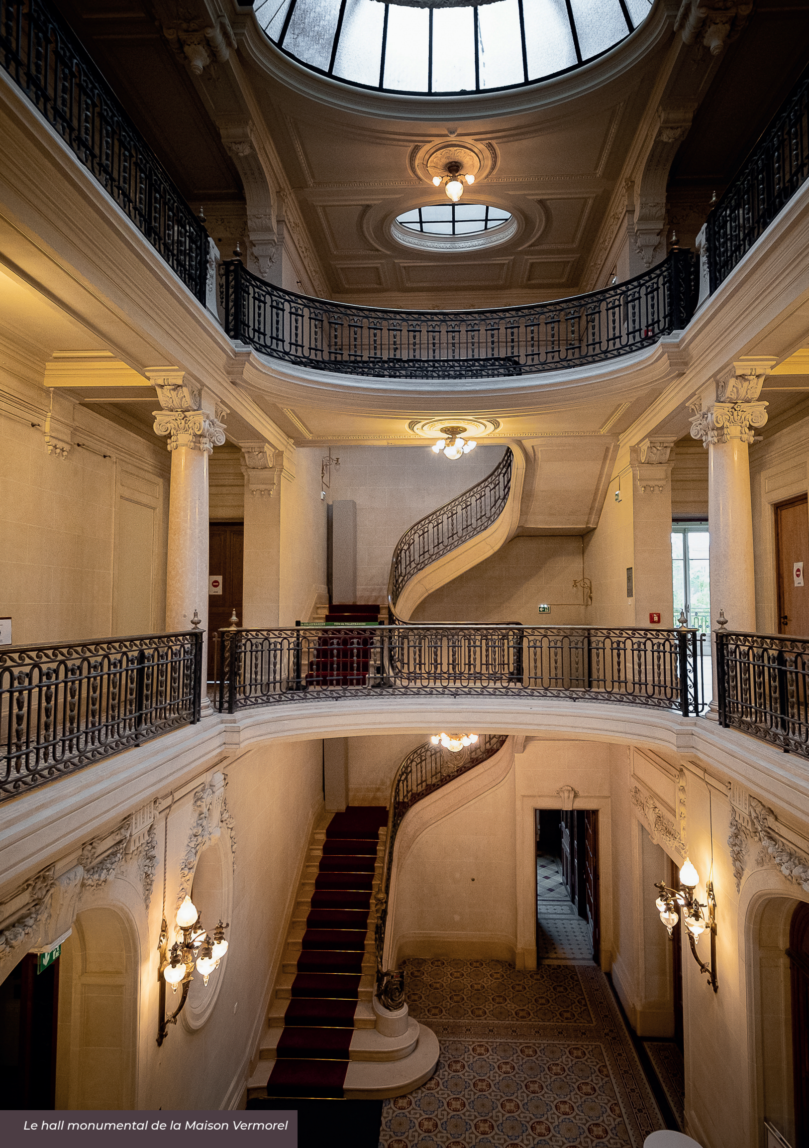
Le hall monumental de la Maison Vermorel