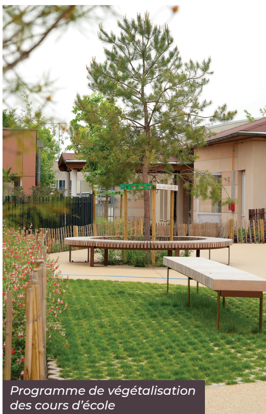
Programme de végétalisation des cours d'école

Dans l'écrin privilégié des collines du Beaujolais et des étangs du plateau de la Dombes, la cité recèle sur son propre territoire des espaces naturels remarquables composés de nombreux parcs municipaux, du val de Saône et du plan d'eau de Bordelan. Les enfants profitent aussi, les mercredis et vacances scolaires, des installations de plein-air du grand centre de loisirs municipal. Enfin, le Plan Environnement & Développement durable de la Municipalité participe de la préservation de la biodiversité et de la qualité de l'atmosphère.