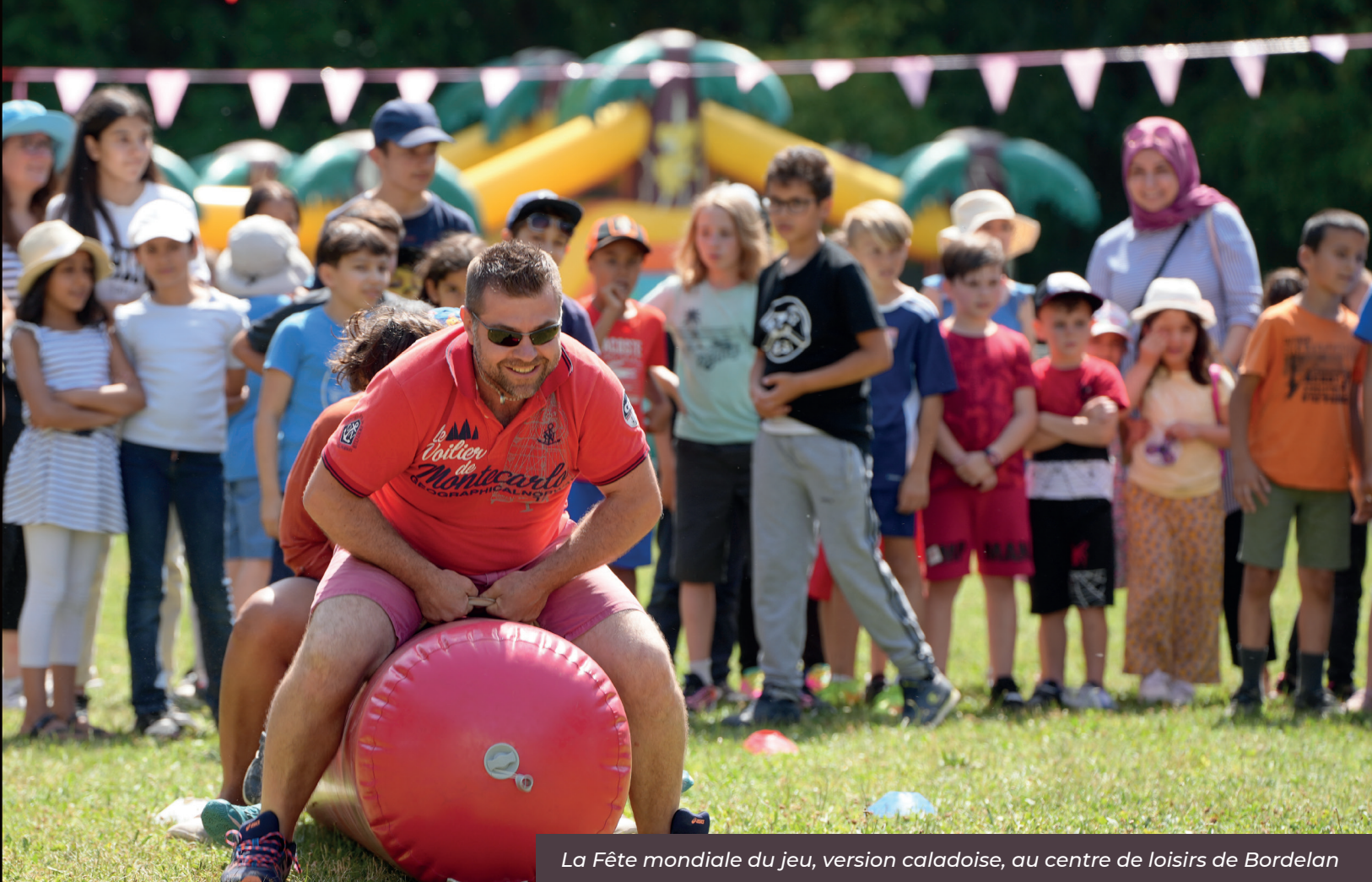
La Fête mondiale du jeu, version caladoise, au centre de loisirs de Bordelan