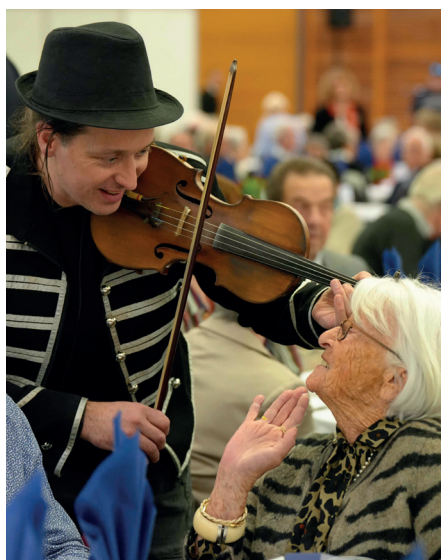
Les 1 000 convives du banquet annuel des aînés ne sauraient manquer cette journée festive de retrouvailles.