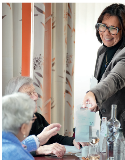
En fin d'année, la visite des EHPAD par les élus est l'occasion d'échanges intergénérationnels chaleureux.