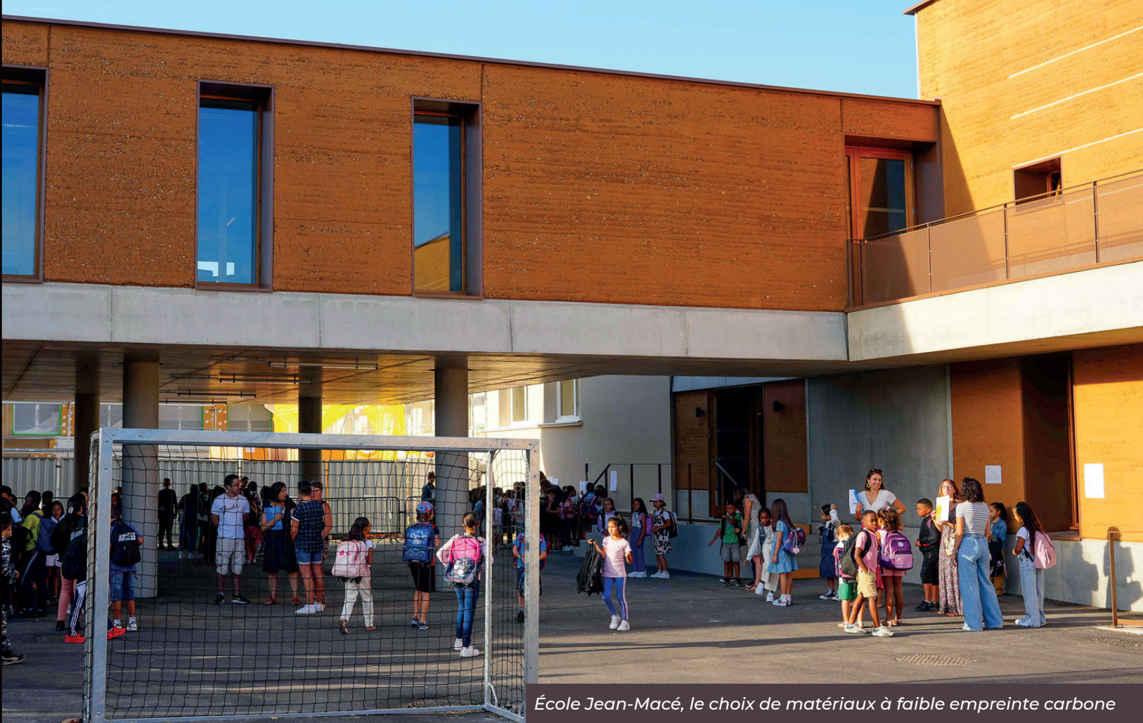
École Jean-Macé, le choix de matériaux à faible empreinte carbone