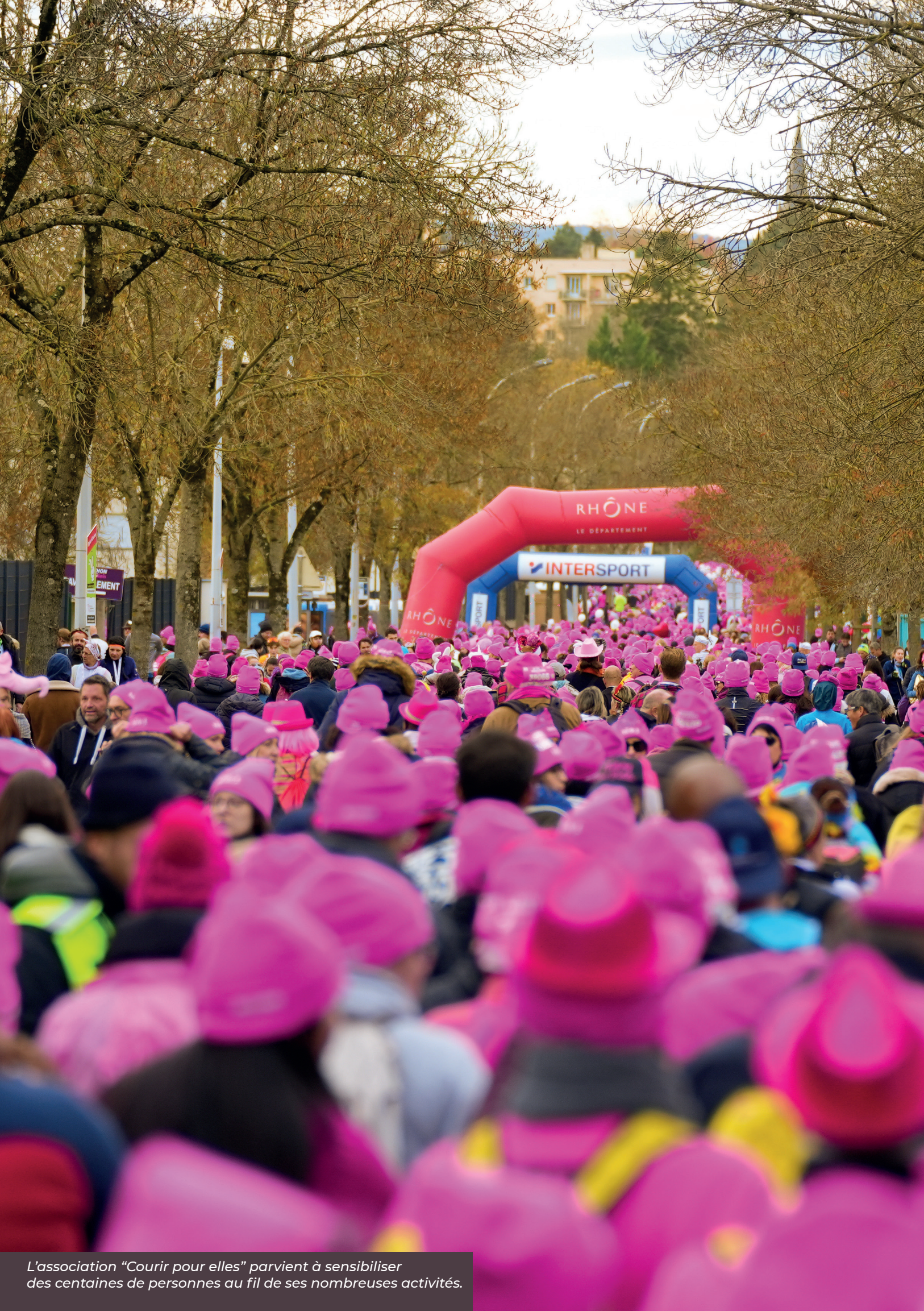
L'association "Courir pour elles" parvient à sensibiliser des centaines de personnes au fil de ses nombreuses activités.