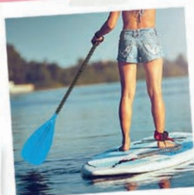
KAYAKS / PADDLES